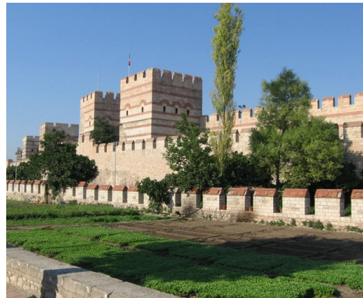
Aspects de la muraille en 1880 et en 2007 (© OUI et FD).

Les opérations sont pilotées par la municipalité, propriétaire et maître d'ouvrage, avec un contrôle souvent théorique du Ministère de la Culture. Jusqu'à ces dernières années, le nombre d'acteurs réellement impliqués sur le plan institutionnel demeurait faible, et le