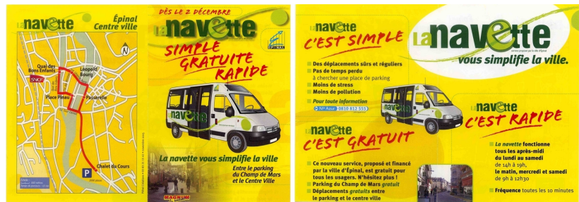
Illustration 4: Document de présentation de la Navette

Ceci montrerait bien la volonté de distinguer les deux services.