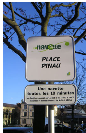
Illustration 3 : Un poteau d'arrêt

Des contrôleurs passent de temps en temps dans le véhicule pour vérifier que tout se passe bien et rassurer les usagers, même si aucun contrôle n'est effectué du fait de la gratuité du système.