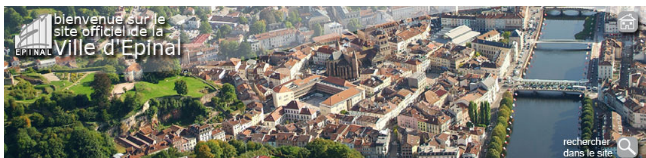
Illustration 2 : Vue d'Epinal