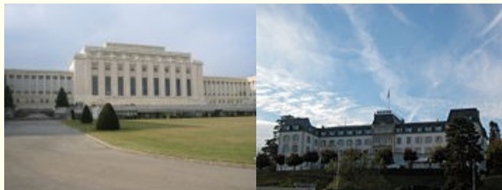
Palais des Nations

Genève accueille régulièrement de nombreuses conférences internationales dont certaines sont restées célèbres.