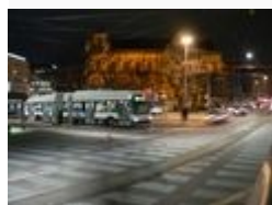
Trolleybus de la ligne 10 (place Cornavin )

On compte 60 lignes de transports publics régulières. 4 sont exploitées par Les Mouettes Genevoises. Les TPG exploitent 27 lignes principales dont 6 exploitées en tramway et 5 en trolley bus, et 29 secondaires – fréquences plus faibles, et 26 (numérotées de A à Z) assurant la desserte régionale et transfrontalière. Suite à la pression de la jeunesse genevoise, 14 lignes fonctionnent depuis 1995 en Noctambus, jusqu'à 4h45.