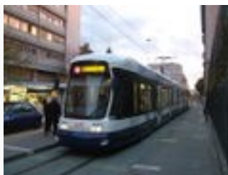
Tramway Bombardier Cityrunner de la ligne 16 (place Simon-Goulart )

Le tramway connaît un regain d'intérêt depuis le début des années 1990. À la ligne qui survécut au démantèlement du réseau de la CGTE (précédent exploitant avant la régie TPG), s'ajoutent 5 nouvelles lignes. Avec l'inauguration de la boucle de Lancy, le 20 mai 2006, un interlignage est créé. Ces 6 lignes transportent une partie importante des voyageurs des TPG. Ces extensions ne